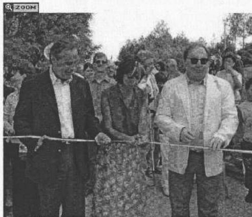
La première inauguration du sentier botanique avait déjà attiré le public.

Autour du lac, «L'Arbre à Portée de Mains», est le lieu de balades botaniques.