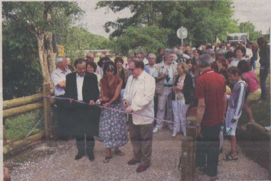
L'inauguration du sentier l'Arbre à portée de mains.

Tout le monde s'est alors engagé sur le sentier à la suite des enfants de l'école de Flourens et des enfants de l'ASEI centre