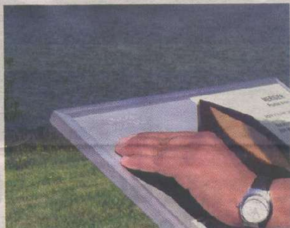
Panneaux pour les malvoyants.

Lestrade pour découvrir les panneaux. Une animatrice de l'association a tout d'abord expliqué comment avait été conçue la maquette: à gauche, un texte en braille, à droite un texte en écriture agrandie lisible pour les personnes malvoyantes. Les deux textes contiennent une information identique sur les caractéristiques de l'arbre de pays présenté. Au centre, une figure en bois en relief représente la silhouette de la feuille. L'inclinaison et la hauteur des panneaux permettent la lecture pour une personne en fauteuil et facilitent la lecture aux personnes aveugles et malvoyantes. Chaque panneau a été lu par les enfants des deux écoles, chacun suivant leur technique, du bout des doigts ou avec les yeux. Au fil du parcours, l'assemblée s'est égrenée le long du sentier, certains prenant le temps de s'approcher des panneaux pour les lire et les toucher, d'autres observant avec attention les personnes non-voyantes lire le