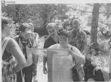
La joie et le plaisir de découvrir.

L'association Arbres et Paysages d'Autan animait le 30 septembre une balade avec une dizaine de personnes adultes déficientes visuelles du Centre de Lestrade ASEI sur le sentier botanique « L'Arbre à portée de mains ». Aménagé au bord du lac à Flourens pour les personnes déficientes visuelles et les personnes à mobilité réduite, ce sentier botanique présente vingt arbres et arbustes de pays, leurs caractéristiques, leurs usages.