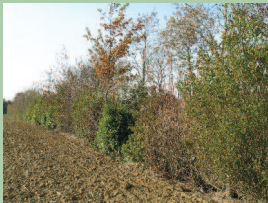
Haie champêtre, libre et colorée