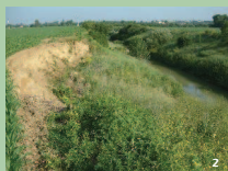
1. Ripisylve dense en bord de l'Hers 2. Effondrement de berges par manque de végétation

De « ripa », la rive et « sylva », la forêt, la ripisylve est une formation végétale riveraine d'un cours d'eau, comprenant: