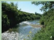
1. Robinier faux-acacia colonisant les berges de rivières 2. Repousses naturelles d'essences champêtres