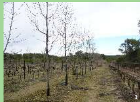
1. Jeune parcelle agroforestière. 2. Un jeune alisier torminal protégé par une gaine anti-foune sauvage 3. Association cornier-vigne