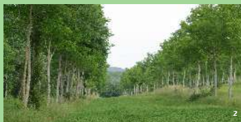
1. Planter pour le bien-être des animaux d'élevage. 2. Cultures entre des lignes de noyers